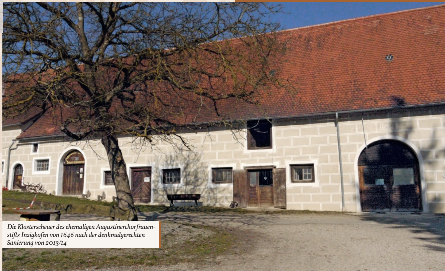
Die Klosterscheuer des ehemaligen Augustinerchorfrauenstifts Inzigkofen von 1646 nach der denkmalgerechten Sanierung von 2013/14

Das gesamte Inventar des Museums rührt von Schenkungen und Erwerbungen von Bauernhöfen in einem Umkreis von ca. 50 Kilometern um den Ausstellungsort her. Inschriften an den Geräten und Maschinen erläutern deren Funktionsweise und verweisen auf ihre Entstehung in einer der einst zahlreichen Landmaschinenfabriken in der Nachbarschaft. Einige der Gerätschaften wie etwa der Göpel laden insbesondere die jüngeren Besucher des Museums zum Testeinsatz unter fachkundiger Anleitung und damit zur leibhaftigen Erfahrung der mühsamen und harten Landarbeit vor noch gar nicht so langer Zeit ein.