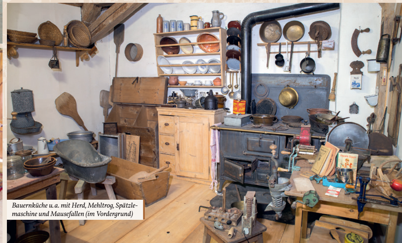
Bauernküche u. a. mit Herd, Mehltrug, Spätzlemaschine und Mausefallen (im Vordergrund)