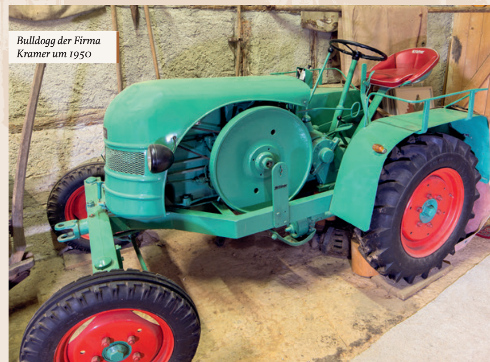
Bulldogg der Firma Kramer um 1950

in der dritten Etappe mit dem Einsatz des Traktors und der damit betriebenen vielseitigen Arbeitsgeräte zur Felderbestellung die Arbeitskräfteeinsparung in den Vordergrund. Erst jetzt entwickelt sich die bäuerliche Landwirtschaft auch in Oberschwaben, die ab Hofgrößen von ca. 10 ha zuvor zwingend auf außerfamiliäre Arbeitskräfte wie Knechte und Mägde sowie saisonal in den Erntezeiten auch auf Tagelöhner angewiesen war, zum Familienbetrieb und langfristig mit der weiter fortschreitenden Technisierung sogar zum Ein-Personen-Unternehmen mit dem saisonalen Einsatz von vielfach ausländischen Erntehelfern zumal in den Sonderkulturen. Für den Beginn dieser dritten Etappe des technischen Strukturwandels steht im Eingangsbereich des Museums der grüne Bulldogg der Firma Kramer aus der Zeit um 1950.