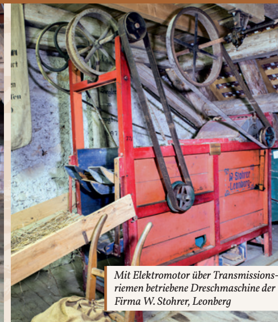
Mit Elektromotor über Transmissionsriemen betriebene Dreschmaschine der Firma W. Stohrer, Leonberg

in der dritten Etappe mit dem Einsatz des Traktors und der damit betriebenen vielseitigen Arbeitsgeräte zur Felderbestellung die Arbeitskräfteeinsparung in den Vordergrund. Erst jetzt entwickelt sich die bäuerliche Landwirtschaft auch in Oberschwaben, die ab Hofgrößen von ca. 10 ha zuvor zwingend auf außerfamiliäre Arbeitskräfte wie Knechte und Mägde sowie saisonal in den Erntezeiten auch auf Tagelöhner angewiesen war, zum Familienbetrieb und langfristig mit der weiter fortschreitenden Technisierung sogar zum Ein-Personen-Unternehmen mit dem saisonalen Einsatz von vielfach ausländischen Erntehelfern zumal in den Sonderkulturen. Für den Beginn dieser dritten Etappe des technischen Strukturwandels steht im Eingangsbereich des Museums der grüne Bulldogg der Firma Kramer aus der Zeit um 1950.