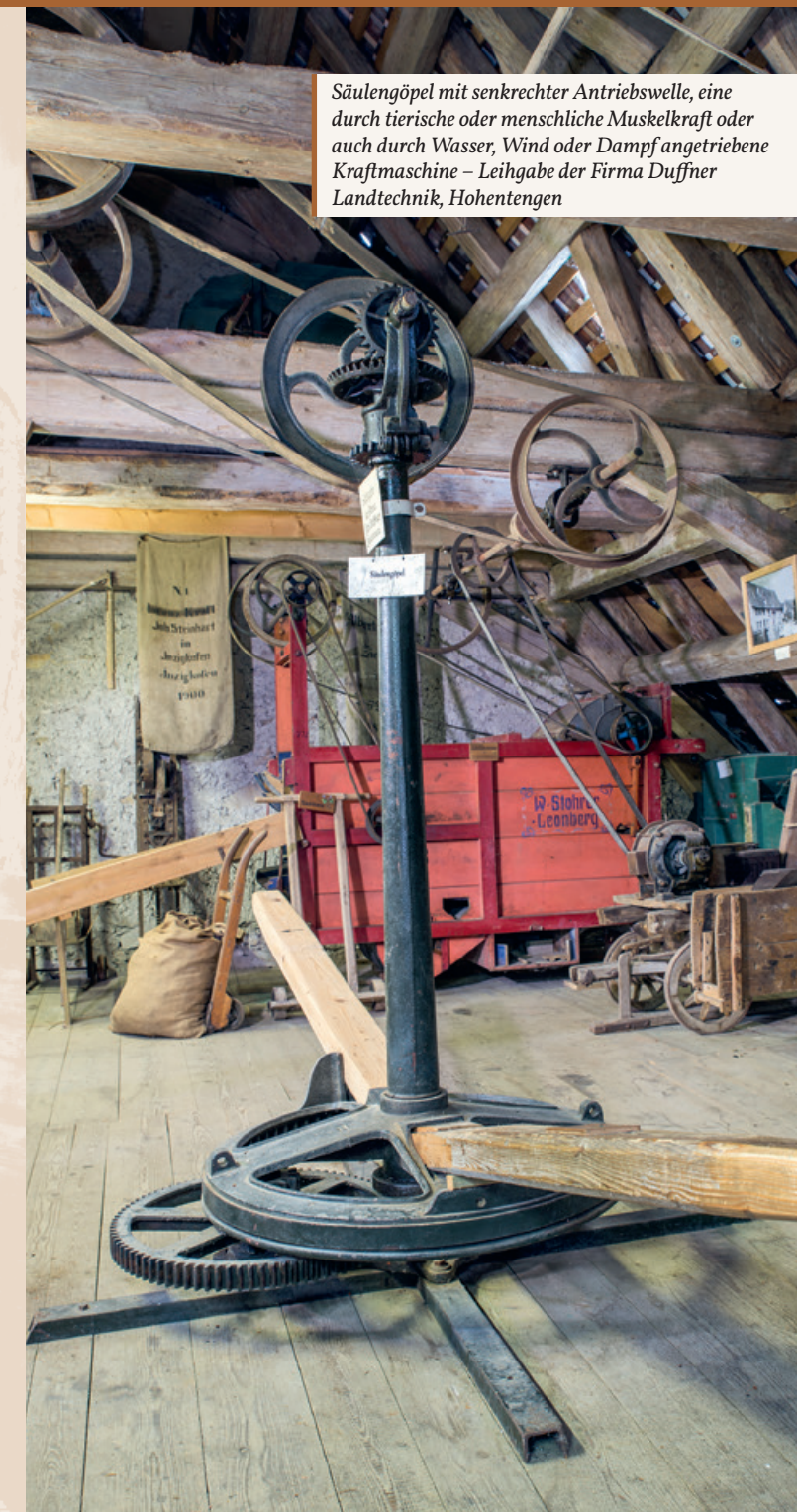
Säulengöpel mit senkrechter Antriebswelle, eine durch tierische oder menschliche Muskelkraft oder auch durch Wasser, Wind oder Dampf angetriebene Kraftmaschine – Leihgabe der Firma Duffner Landtechnik, Hohentengen