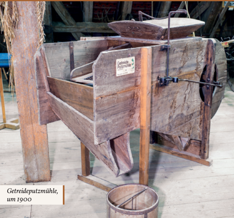
Getreideputzmühle, um 1900

auch ein Stück Selbstdarstellung ihres bäuerlichen Rangs und Wohlstands waren.